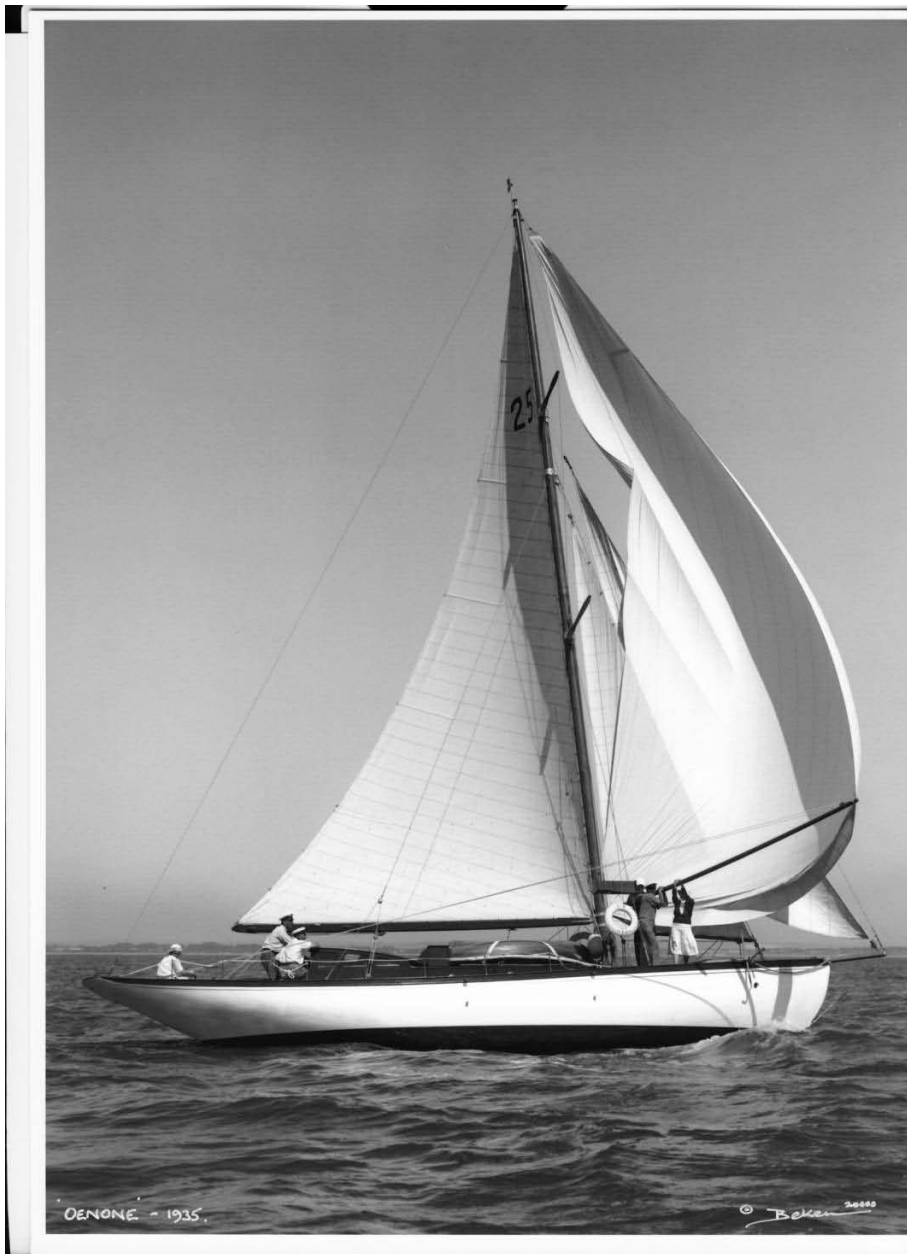
Oenone in navigazione con fiocco a pallone nel 1935